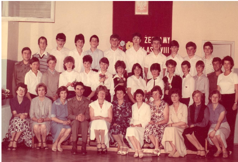
Grono pedagogiczne, rodzice i absolwenci szkoły 50