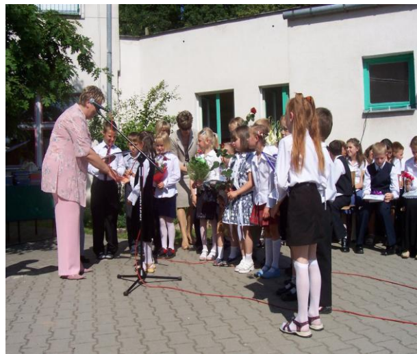
Zakończenie roku szkolnego 2004/2005