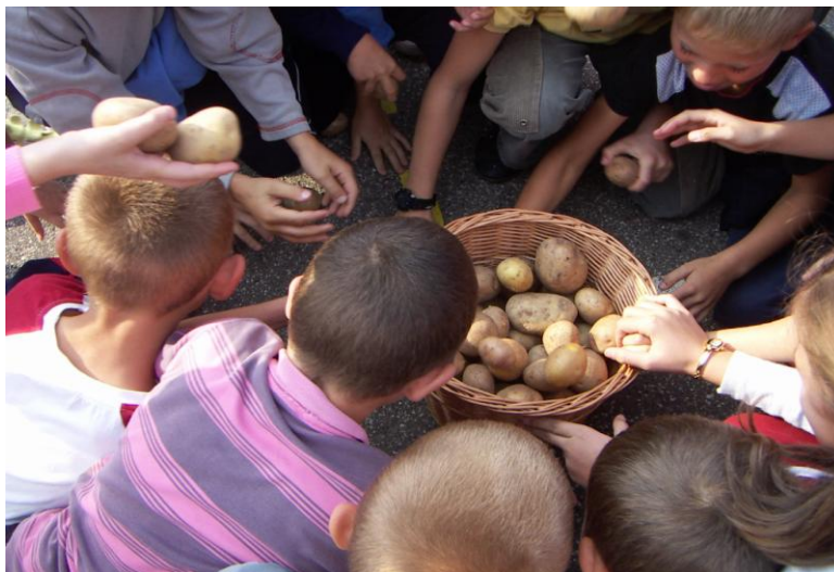
Święto Pieczonego Ziemniaka 59

We wrześniu 2005 roku po raz pierwszy zostało zorganizowane Święto Pieczonego Ziemniaka. Nauczyciele przygotowali dla uczniów klas 0-III konkursy przyrodnicze i sportowe. Rodzice przywieźli ziemniaki i drewno na ognisko.