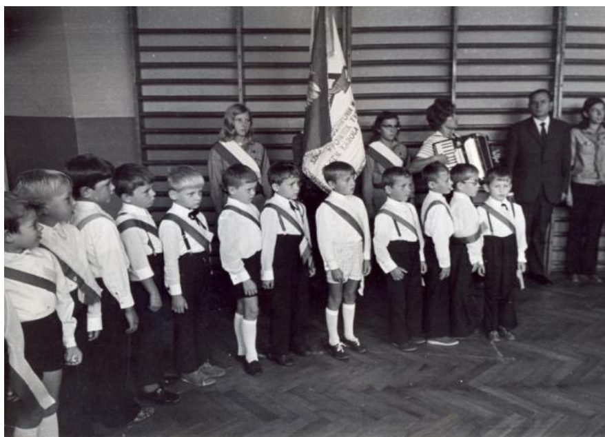
Jesteśmy uczniami Szkoły Podstawowej w Białobrzegach 38

Wycieczki i obozy stwarzały uczniom możliwość poznania kraju. Od 1966 r., przez cztery kolejne lata, szkoła organizowała obozy wędrowne dla uczniów zrzeszonych w kole