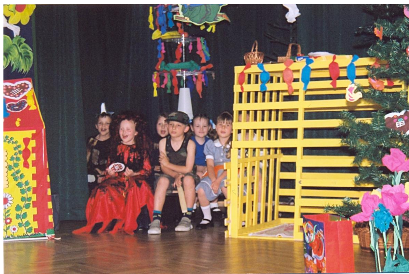
Jaś i Małgosia 82