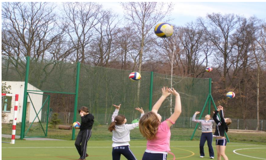
Boisko ze sztuczną trawą powstało w 2006 r.