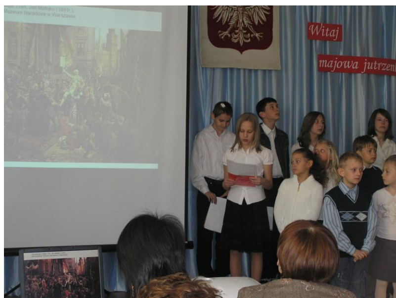
Akademia z okazji 3 Maja w roku 2007 77

Uroczystości obchodzimy święto uchwalenia Konstytucji 3 Maja. W 2007 r., analizując obraz Jana Matejki Konstytucja 3 Maja , uczniowie poznawali historię uchwalenia Konstytucji. Uroczystość przygotowali uczniowie klasy VI z uczniami klasy II. W 2009 r. montaż słowno-muzyczny przygotowali uczniowie klas II i III. W czasie uroczystości uczniowie klas IV-VI