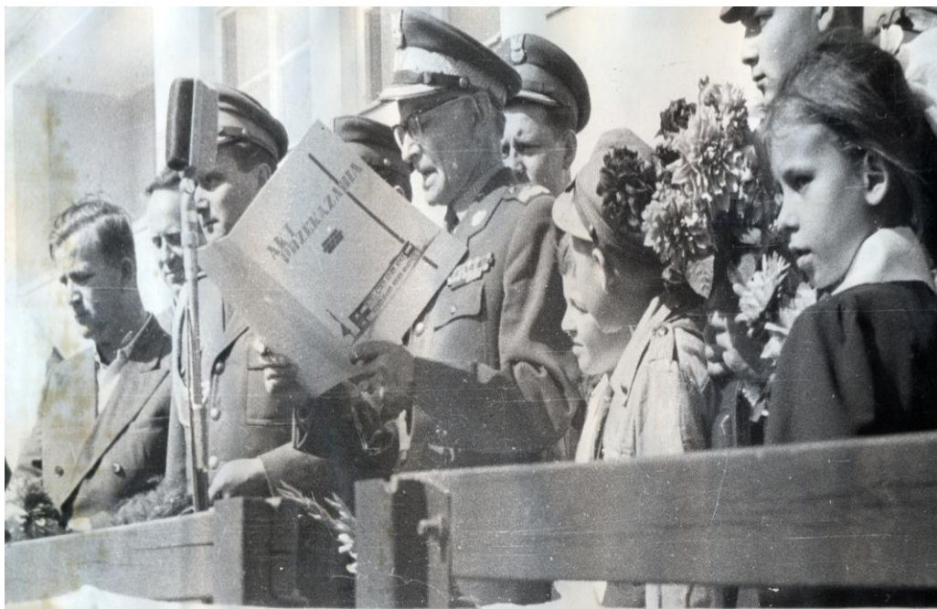
Generał brygady Artur Jastrzębski odczytuje akt przekazania szkoły 25

1 września 1961 r. – komisja wyznaczona przez Inspektorat Oświaty w PRN w Nowym Dworze odebrała budynek gotowy do użytku.