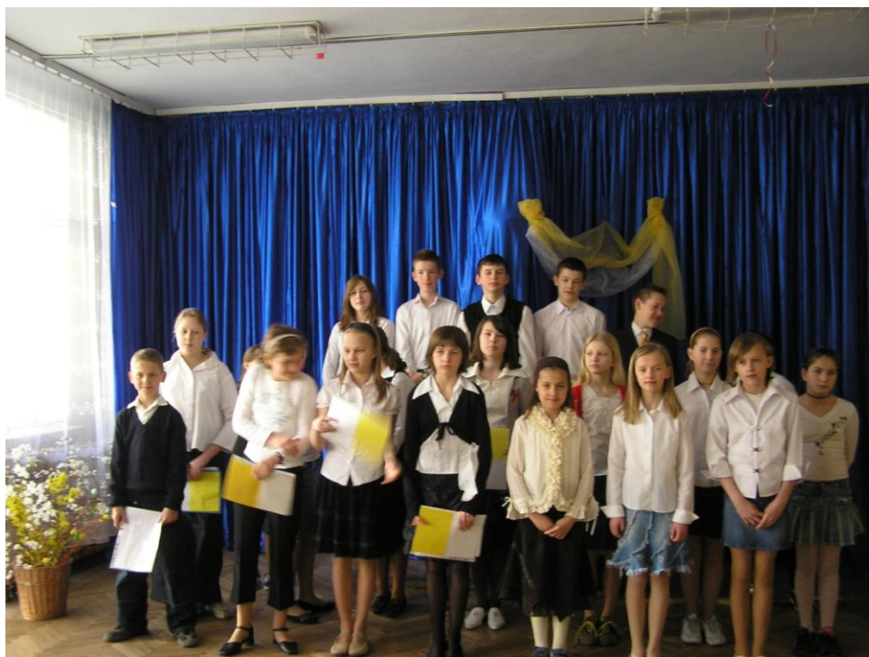
Pamiętaliśmy o drugiej rocznicy śmierci Jana Pawła II 72