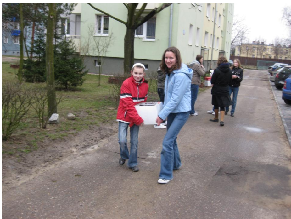
Od 5 lat przed świętami zbieramy makulaturę 66