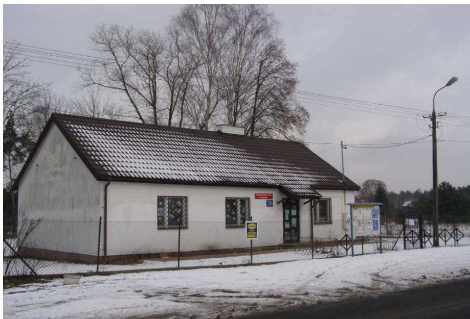
Budynek szkolny w Beniaminowie – stan obecny 8

Dlaczego wybudowano szkołę w Beniaminowie, skoro istniała szkoła w Dąbkowiznie? Mieszkańcy wsi nie byli zadowoleni z tego, że małe dzieci, których było dużo w Beniaminowie, chodzą do szkoły w odległej Dąbkowiznie, dlatego też w roku 1960 w swojej wsi, na ziemi należącej do wspólnoty wiejskiej, wybudowali w czynie społecznym budynek szkolny dla najmłodszych dzieci. Była to dwuklasowa filia szkoły w Dąbkowiznie. „W niewielkim budynku,