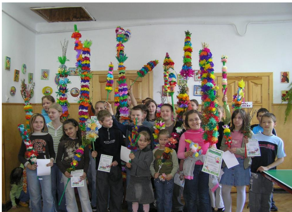
Palmy w 2007 r. 71