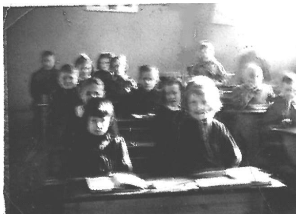
W ławce szkolnej – rok 1958 15