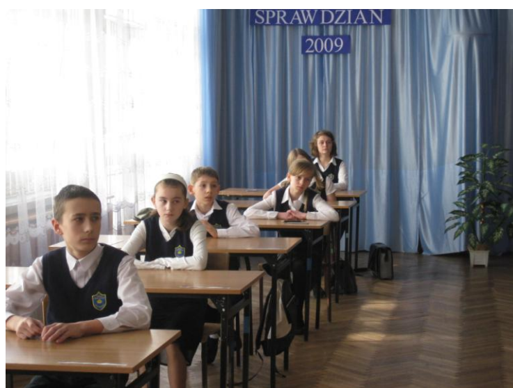
Sprawdzian kompetencji w 2009 r.- czekamy na arkusze egzaminacyjne 76