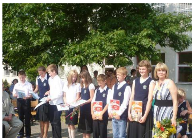
Zakończenie roku szkolnego 2007/2008