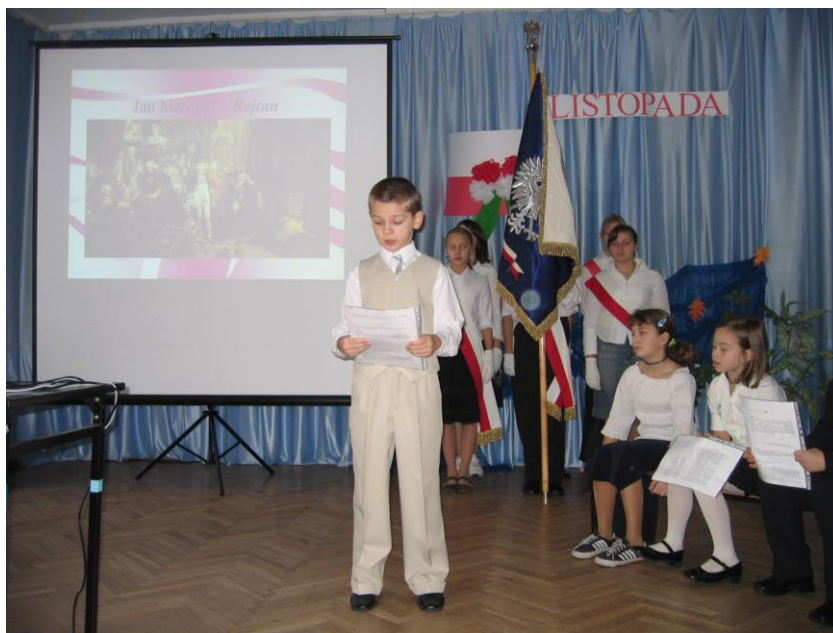
Uroczyste obchody Święta Odzyskania Niepodległości w roku 2006 61

Obchody Święta Odzyskania Niepodległości zajmują stałe miejsce w naszym kalendarzu uroczystości. Co roku przygotowuje akademię inna klasa. Uroczystości mają różne formy. Czasami jest to montaż słowno-muzyczny, któremu towarzyszy prezentacja multimedialna, czasami jest to przedstawienie związane z uroczystością.