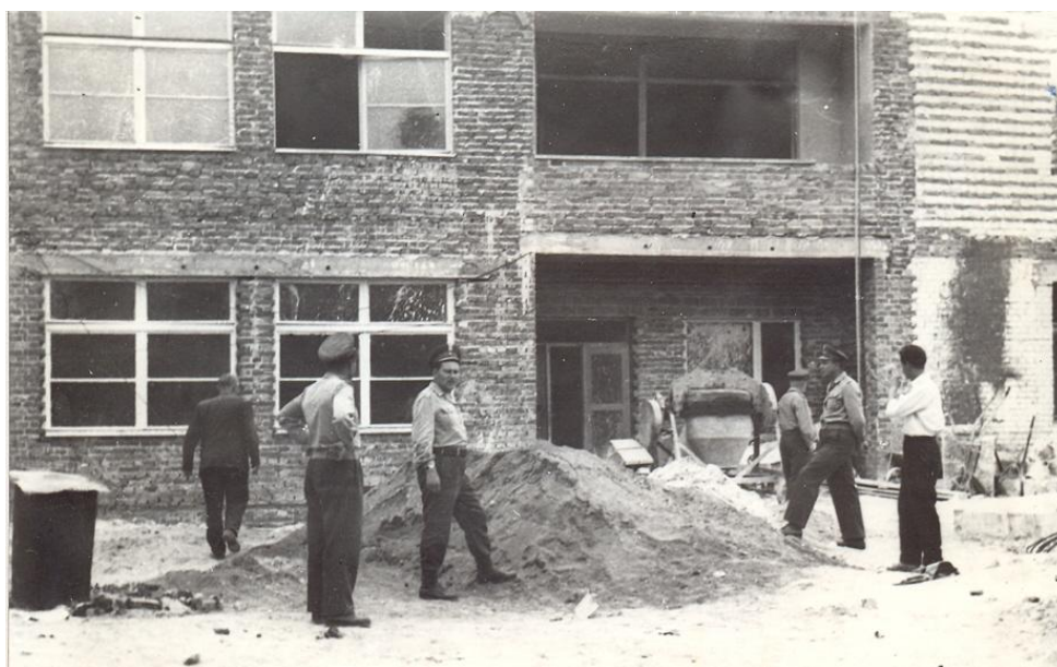
Budowa szkoły 22

„30 maja 1960 r. – zakończono betonowanie stropów nad halą gimnastyczną i nad parterem budynku.