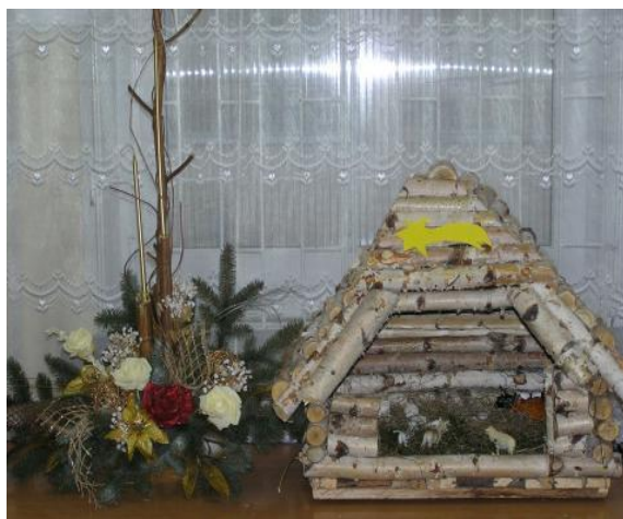
Konkurs na szopkę bożonarodzeniową – 2007 r.