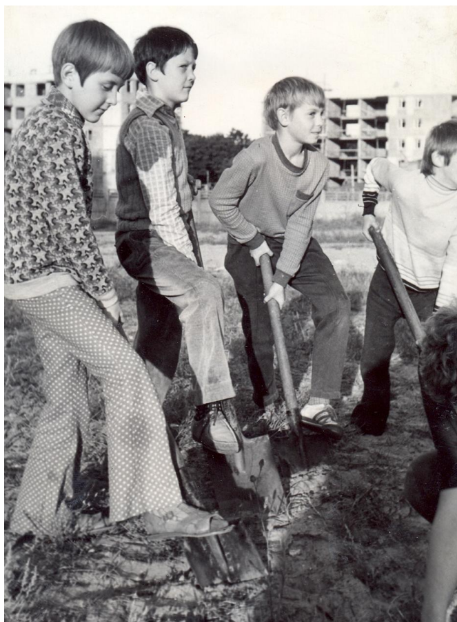
Prace społeczne uczniów na boisku szkolnym w 1974 r. 47