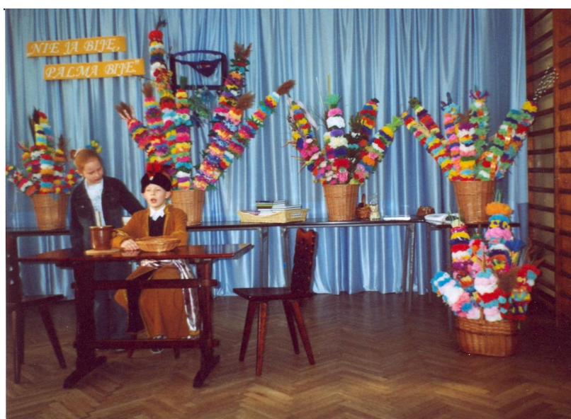
W 2004 r. uroczystości wręczenia nagród za najładniejszą palmę wielkanocną towarzyszyło przedstawienie ilustrujące zwyczaje wielkanocne Nie ja biję, palma biję 70

Pomysł Konkursu na najładniejszą palmę wielkanocną zrodził się w 2002 r. i był związany z realizacją ścieżki regionalnej. Wzorów naszych palm szukaliśmy na Kurpiach i w Muzeum Ziemi Mazowieckiej w Sierpcu. Uczniowie w czasie lekcji poznają zasady robienia kwiatów z krepiny, następnie korzystając z pomocy rodziców wija palmy. Zgodnie z regulaminem nie używają roślin chronionych do zdobień.