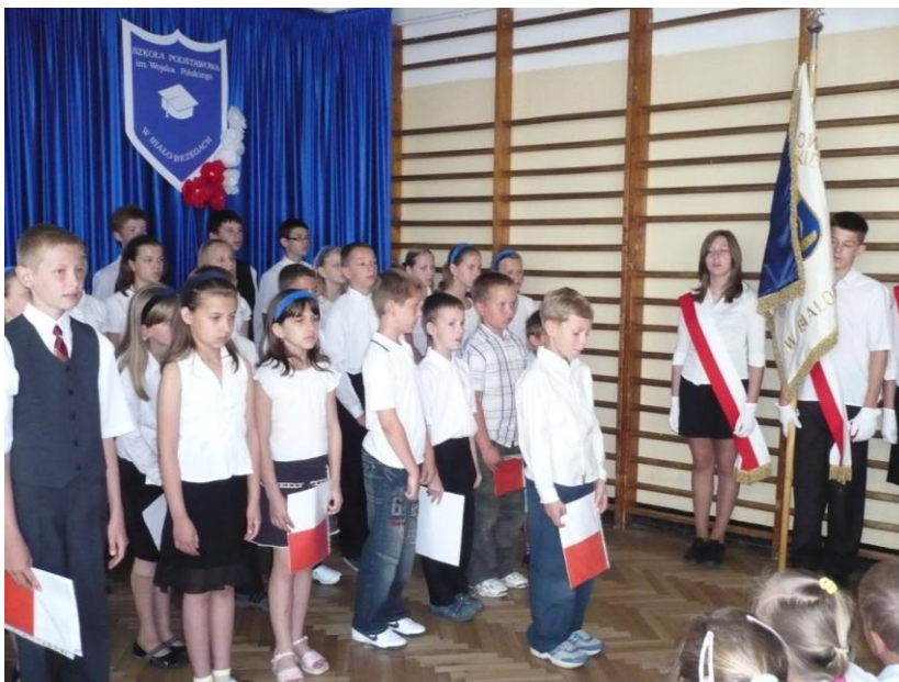
Święto szkoły w 2007 r.

Od 2005 roku obchodzimy pod koniec maja Święto Szkoły. Uroczystość jest okazją do podsumowania pracy uczniów. Tego dnia dyrektor szkoły wręcza dyplomy i nagrody zwycięzcom konkursów: ortograficznych, gramatycznych, matematycznych, historycznych, przyrodniczych. Poznajemy Mistrza Złotego Pióra oraz zwycięzców Konkursu na Króla