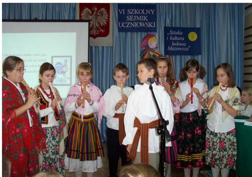
VI Sejmik Uczniowski 63

VII Sejmik Uczniowski obradował 31.10.2007r. i przebiegał pod hasłem Mierz wysoko, zostań mistrzem sportu . Uczniowie klasy przedszkolnej i klas I – VI przez cały rok szkolny podnosili swoją sprawność fizyczną, by brać udział w zawodach 1. czerwca. Ponadto realizując uchwałę VII Sejmiku zorganizowali debatę gminną Sport w gminie Nieporęt .