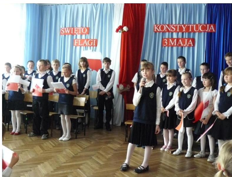
Montaż słowno-muzyczny w 2009 r. 78

przeczytali swoje wiersze o barwach narodowych i tak święto Flagi weszło do kalendarza uroczystości szkolnych.