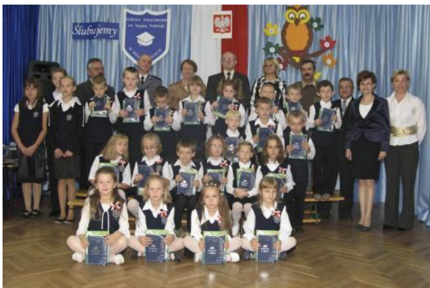
Pasowanie na ucznia w roku szkolnym 2008/2009 60

14 października każdego roku – w Dniu Święta Edukacji Narodowej – uczniowie klas szóstych i Samorząd Uczniowski przyjmują uczniów pierwszej klasy do społeczności naszej szkoły. Pierwszoklasiści składają uroczyste ślubowanie, a dyrektor szkoły pasuje ich na uczniów I klasy.