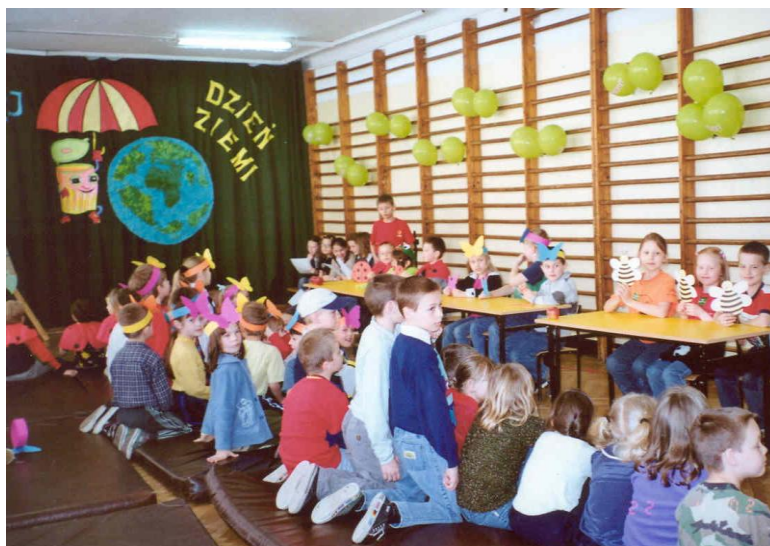
Śmietniczek Dominiczek przygląda się pracy dzieci 73