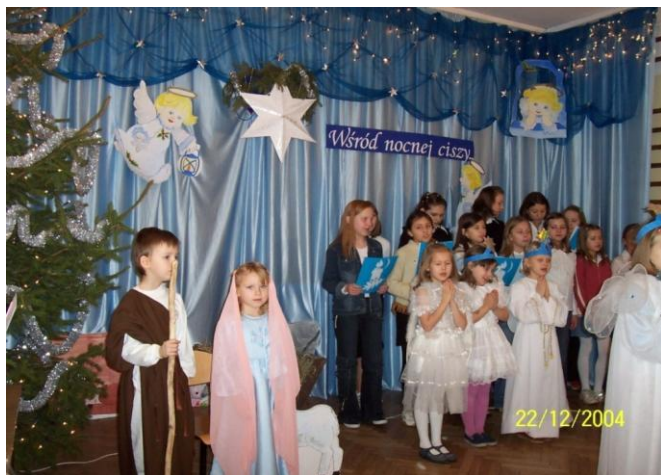
Wśród nocnej ciszy – 2004 r.

W latach osiemdziesiątych po raz pierwszy w szkole wychowawcy organizowali w swoich klasach spotkania wigilijne. Od 1999 r., w tygodniu poprzedzającym Święta Bożego Narodzenia, uczniowie i nauczyciele gromadzą się w sali gimnastycznej, by uczestniczyć w spotkaniu wigilijnym. Co roku uczniowie przygotowują montaż słowno-muzyczny lub przedstawieniem teatralne. W czasie spotkania uczestnicy śpiewają kolędy, pastorałki i dzielą się opłatkiem. Uroczystość jest okazją do nagrodzenia zwycięzców szkolnego konkursu na szopkę Bożonarodzeniową (od 2005 r.) i stroik świąteczny(od 2007 r.)