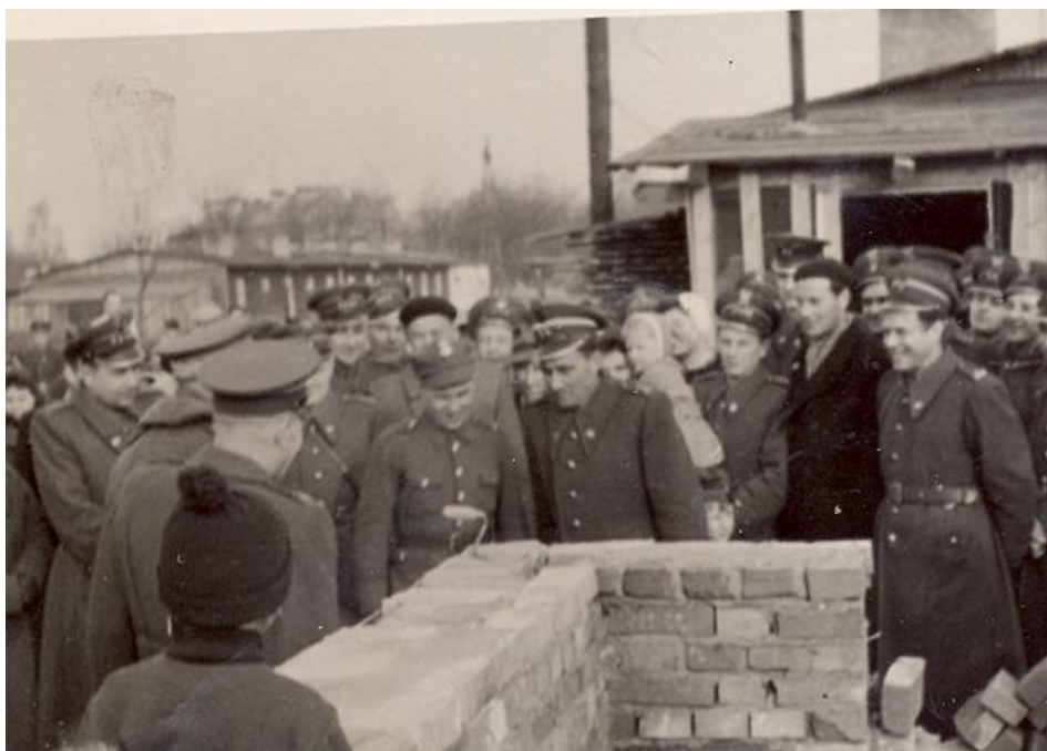
Wmurowanie Aktu erekcyjnego 20