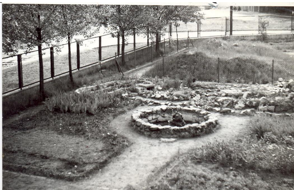
Ogródek botaniczny 46

W listopadzie 1973 r. z polecenia Urzędu Gminy został wyasfaltowany tylko plac przed wejściem do szkoły od strony ulicy.