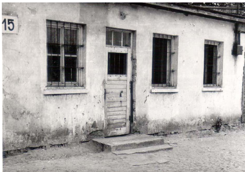
W tym baraku uczyły się dzieci w latach 1957-1961 14

w jak trudnych warunkach uczyło się 44 uczniów klas I-III. Nauka odbywała się na dwie zmiany. Klasa druga pracowała razem z klasą trzecią. Szkoła mieściła się w murowanej części baraku usytuowanego tuż przy bramie, po jej lewej stronie. Były tam dwa pomieszczenia z wąskim korytarzem i łazienką. Jedną z sal przeznaczono na klasę lekcyjną, drugą do zajęć ruchowych zimą i w czasie słoty. W sali tej był też, pełniący rolę szatni, wieszak na ubrania.