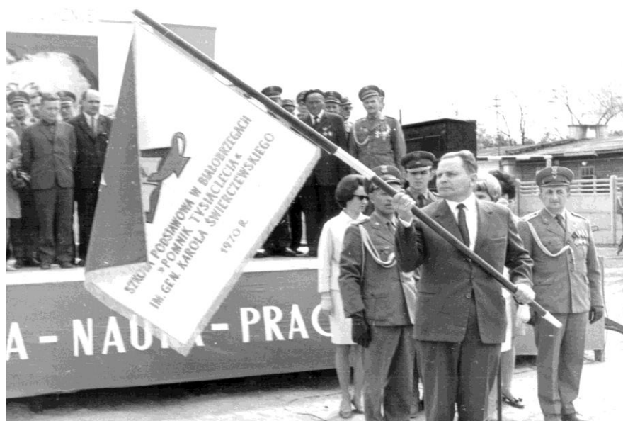
Dyrektor szkoły prezentuje sztandar 35