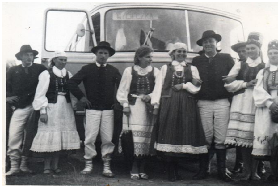
Na kurpiowskim szlaku 39

turystyczno – krajoznawczym. W 1966 r. młodzież wędrowała szlakiem kurpiowskim, rok później szlakiem kujawskim. W roku 1968 poznała wschodnią część Mazowsza, a w roku 1969 wędrowała szlakiem południowego Mazowsza.