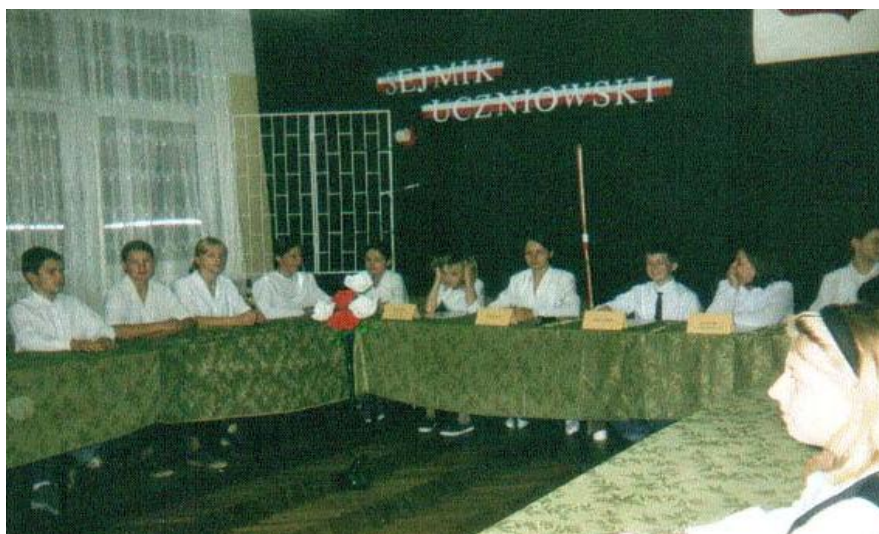
I Sejmik Uczniowski 62