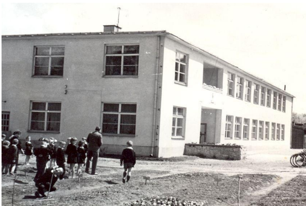
Budynek szkolny w roku 1961 – widok od strony ogródka 31