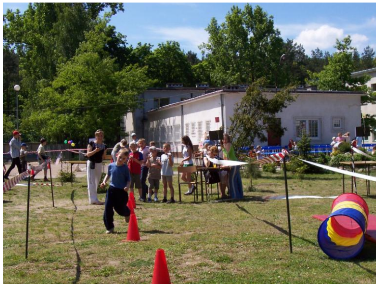
Dzień Dziecka na sportowo 80

Od 2008 roku Dzień Dziecka jest także podsumowaniem rocznych osiągnięć sportowych uczniów.