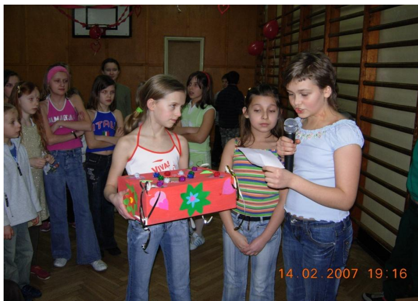
W lutym bawią się nie tylko zakochani 69