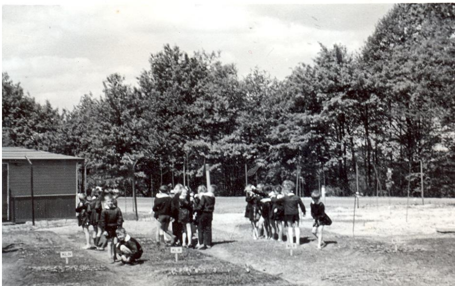
Prace na działce szkolnej w 1965 r. 42