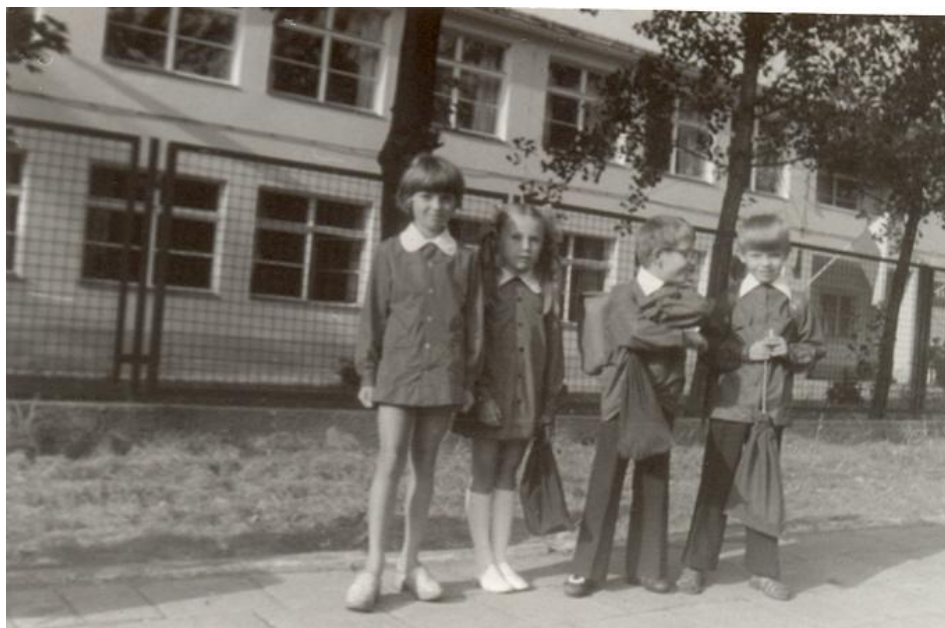
Uczniowie przed nowym ogrodzeniem szkoły 44

Trwają prace w ogródku biologicznym i geograficznym. W 1968 roku żołnierze ze Szkoły Podoficerskiej zbudowali ogródek geograficzny, alpinarium i fontannę. Dalsze prace w ogródku geograficznym sukcesywnie wykonywali uczniowie klasy X Liceum Ogólnokształcącego dla Pracujących.