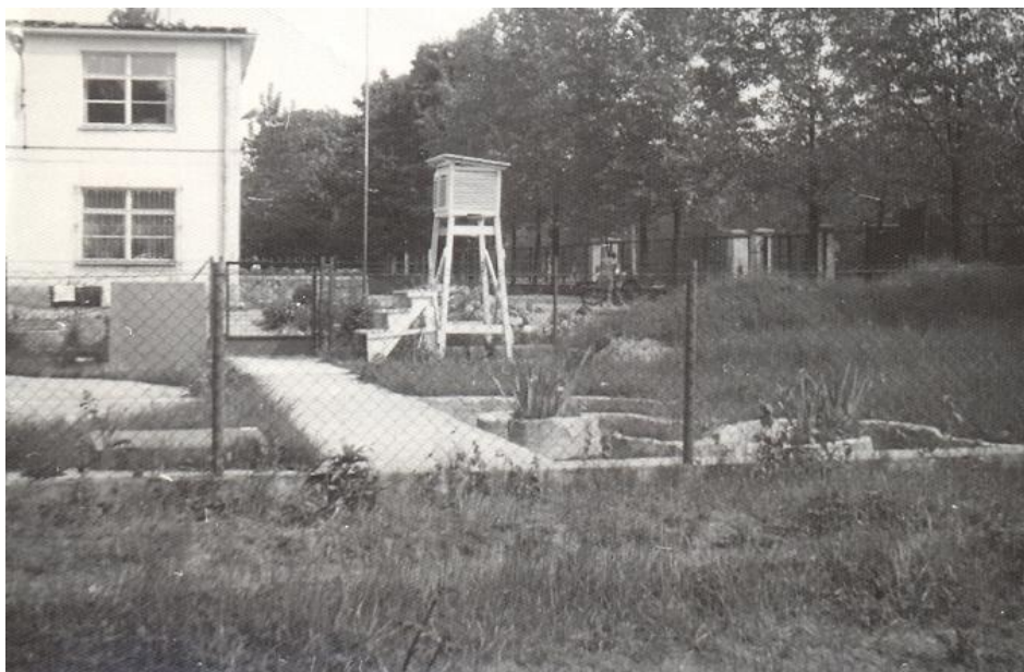
Ogródek geograficzny 45