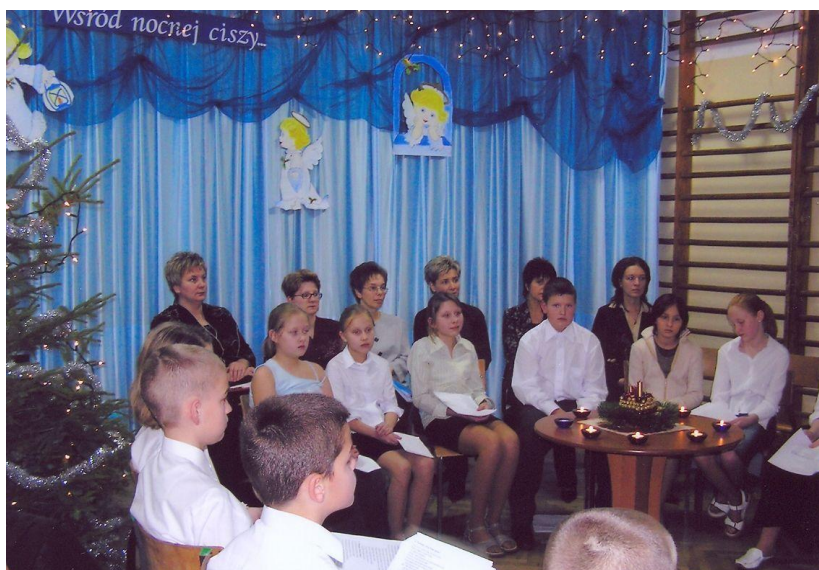
Wigilia szkolna w roku 2005 67