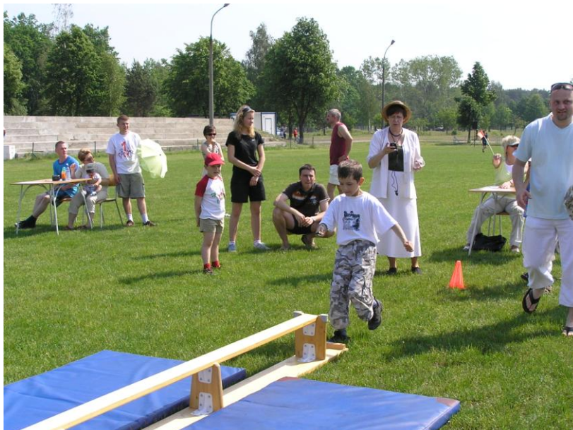
Dzień Dziecka na sportowo 79

Dzień Dziecka w naszej szkole zawsze łączył się z zabawami i konkursami. Jest to dzień wolny od zajęć dydaktycznych. Nauczyciele przygotowują różnorodne konkurencje sportowe, konkursy plastyczne i muzyczne. Niektóre konkurencje przeznaczone są dla całej rodziny. Każdy uczeń, który bierze udział w konkursach, otrzymuje nagrody.