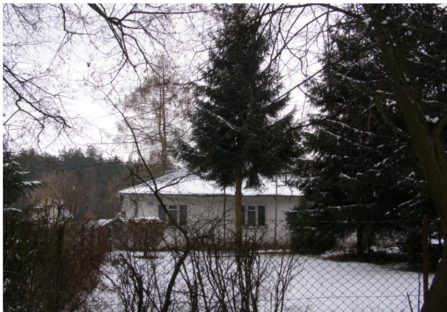
Dąbkowizna - tym budynku przed laty była szkoła 6