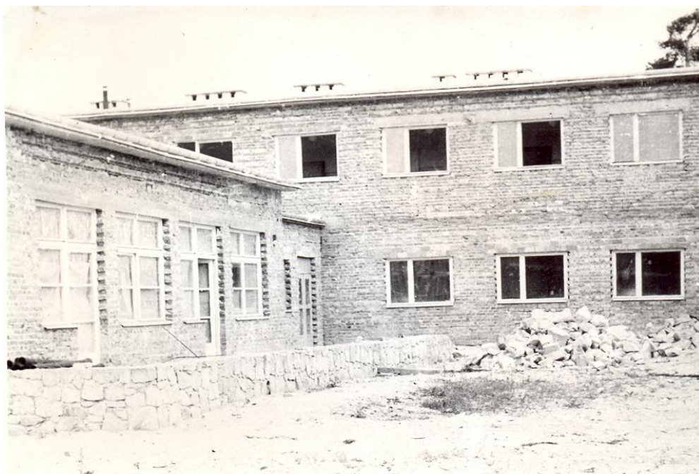
Nowa szkoła – widok od strony sali gimnastycznej 23

Maj 1961 r. – Zakończono kładzenie tynków wewnętrznych w części tylnej budynku.