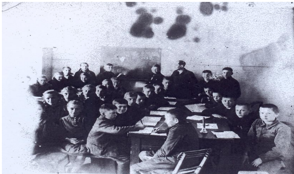
Sala lekcyjna w szkole w Dąbkowiznie 7