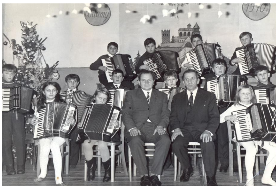
Występy młodzieży w czasie choinki szkolnej 34