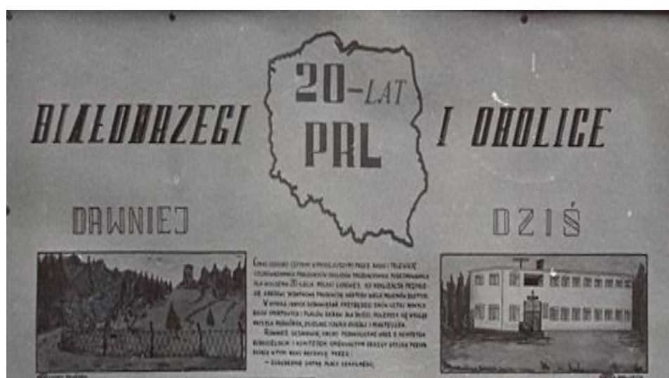
Tu wybudujemy szkołę dla naszych dzieci 16